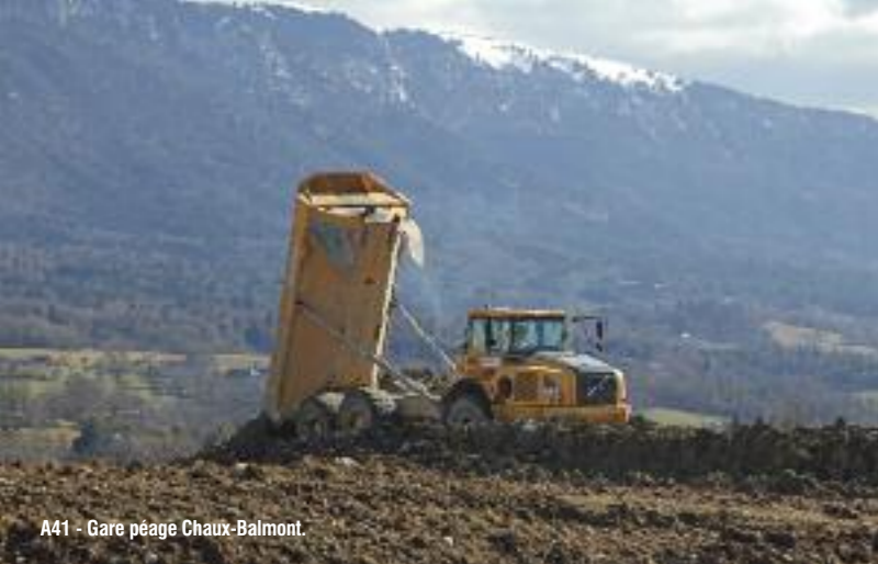
A41 - Gare péage Chaux-Balmont.