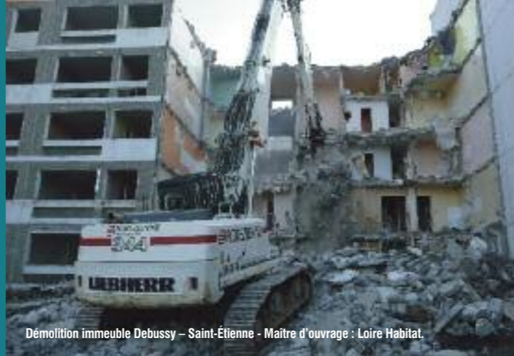
Démolition immeuble Debussy - Saint-Étienne - Maître d'ouvrage : Loire Habitat.