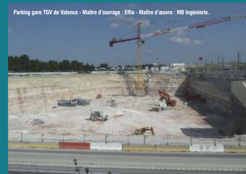
Parking gare TGV de Valence - Maître d'ouvrage : Effia - Maître d'œuvre : MB Ingénierie.