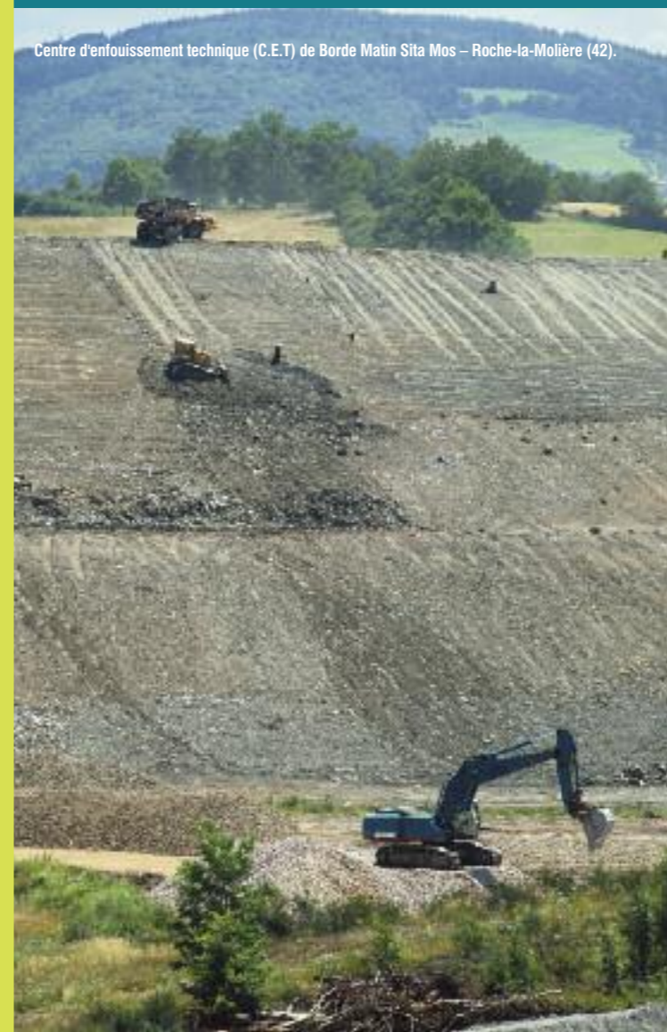
Centre d'enfouissement technique (C.E.T) de Borde Matin Sita Mos - Roche-la-Molière (42).