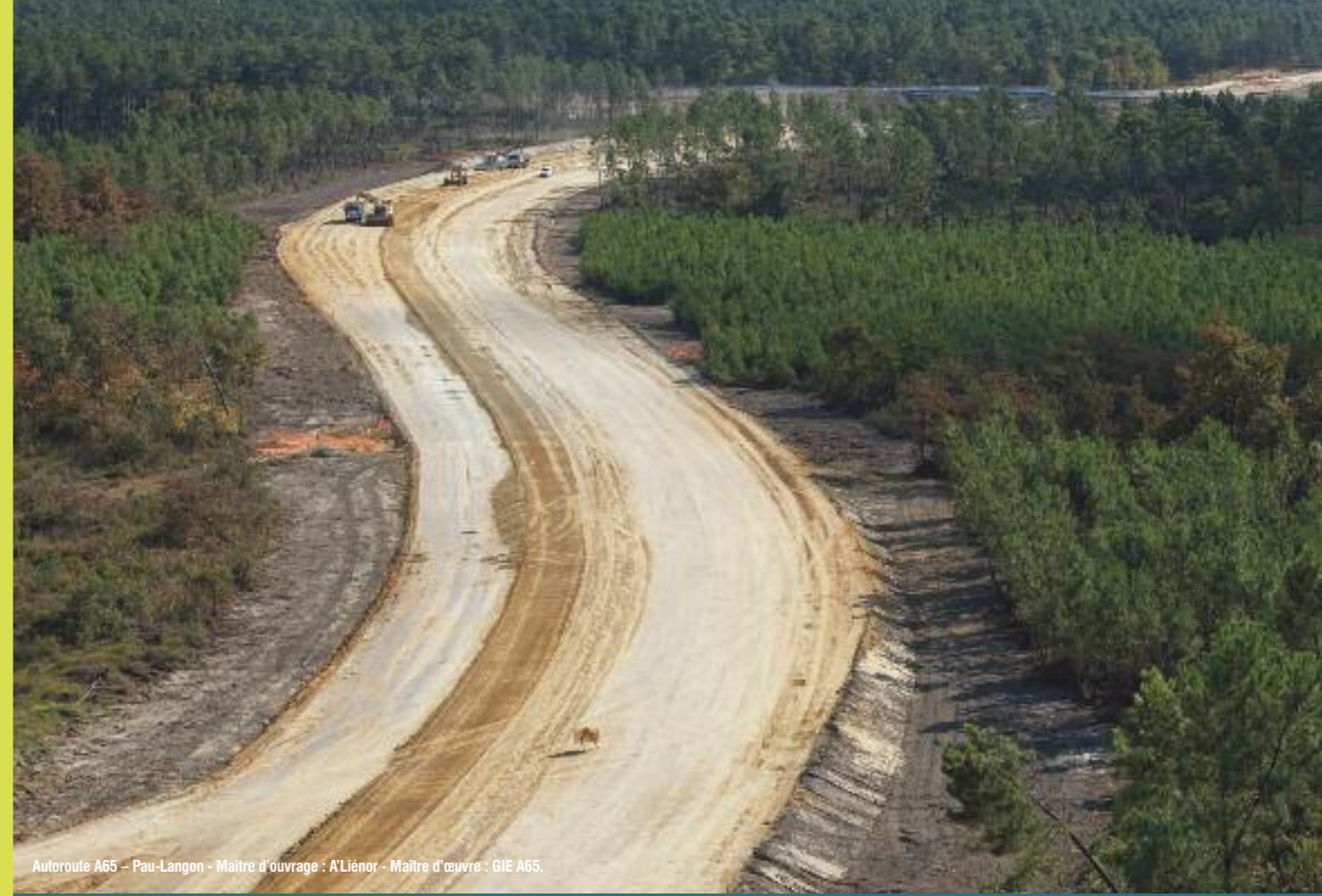
Autoroute A65 - Pau-Langon - Maître d'ouvrage : A'Liéonor - Maître d'œuvre : GIE A65.

Spécialiste des travaux de terrassement, la société Forézienne d'Entreprises est née à Saint-Étienne en 1928. Forte de 350 collaborateurs, elle réalise chaque année quelque 60 millions d'euros de chiffre d'affaires, à travers des chantiers menés dans les régions Rhône-Alpes, Auvergne, Sud-Ouest et Méditerranée. Elle dispose également des capacités nécessaires à la réalisation d'opérations d'envergure dans toute la France. Intégrée au groupe Eiffage, auquel elle apporte un savoir-faire précieux sur de nombreuses opérations, elle est aujourd'hui rattachée, au sein d'Eiffage Travaux Publics, à la direction régionale Rhône-Alpes / Auvergne.