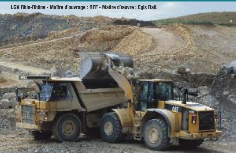
LGV Rhin-Rhône - Maître d'ouvrage : RFF - Maître d'œuvre : Egis Rail.

Spécialiste des travaux de terrassement, la société Forézienne d'Entreprises est née à Saint-Étienne en 1928. Forte de 350 collaborateurs, elle réalise chaque année quelque 60 millions d'euros de chiffre d'affaires, à travers des chantiers menés dans les régions Rhône-Alpes, Auvergne, Sud-Ouest et Méditerranée. Elle dispose également des capacités nécessaires à la réalisation d'opérations d'envergure dans toute la France. Intégrée au groupe Eiffage, auquel elle apporte un savoir-faire précieux sur de nombreuses opérations, elle est aujourd'hui rattachée, au sein d'Eiffage Travaux Publics, à la direction régionale Rhône-Alpes / Auvergne.