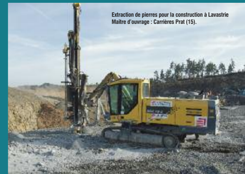
Extraction de pierres pour la construction à Lavastrie Maître d'ouvrage : Carrières Prat (15).